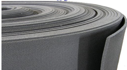
Isolon 300 рулон

Минимальная сумма отпуска товара - от 2 000 руб.