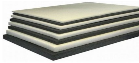
Isolon 300 маты 1 x 2 м